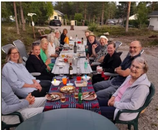
Bild från fjolårets gatufest

Alla som äger en fastighet på Olerstakten är välkomna och har man besök av släkt och vänner så är de också välkomna. Man tar med stol, bord, mat och dryck och ett gott humör, sen umgås man så länge man orkar. Vi ställer in vid otjänlig väderlek Vi ses!